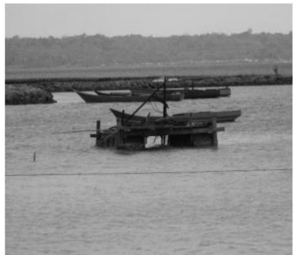
Gambar 1. Teknik penambangan pasir (Nugraha, 2017)

Hal ini didukung oleh penelitian yang dilakukan oleh Nugraha (2017) terkait penambangan pasir laut pada pesisir Taman Nasional Laut Wakatobi. Di Pelabuhan Marina, kegiatan penambangan pasir laut dilakukan dengan memanfaatkan rumpon (gambar 1) yang berfungsi untuk menyedot pasir langsung dari dasar laut, kemudian material ini diangkut ke darat. Aktivitas ini berlangsung karena sumber pasir di wilayah tersebut berada dekat dengan garis pantai. Berbeda dengan daerah lain, penambang di Waha memanfaatkan pasir laut secara terbatas untuk kebutuhan pribadi. Penambangan dilakukan hanya selama musim barat, ketika pasir terkumpul di tepi pantai, lalu dipindahkan ke daratan. Pasir hasil penambangan ini umumnya digunakan sebagai bahan baku pembuatan batako (gambar 2a) dan material konstruksi rumah (gambar 2b) di sekitar Pulau Wangi-Wangi.