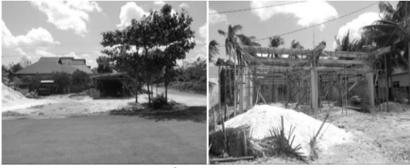
Gambar 2. Pemanfaatan pasir laut di Pulau Wangi-Wangi (Nugraha, 2017)

Saat ini, aktivitas penambangan pasir laut hanya diizinkan untuk kebutuhan masyarakat setempat. Kebijakan ini diterapkan karena adanya indikasi penurunan hasil panen rumput laut yang dikaitkan dengan meningkatnya kegiatan penambangan. Penambangan pasir mempengaruhi kualitas perairan di lokasi budidaya, menyebabkan tingkat kekeruhan meningkat, sehingga rumput laut sering tertutup oleh lapisan lumpur yang mengendap. Hal ini berdampak buruk pada pertumbuhan dan produktivitas rumput laut di wilayah tersebut.