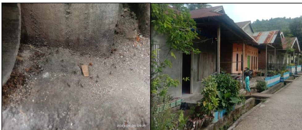
Gambar 2. Foto semut yang terdapat di lingkungan rumah warga