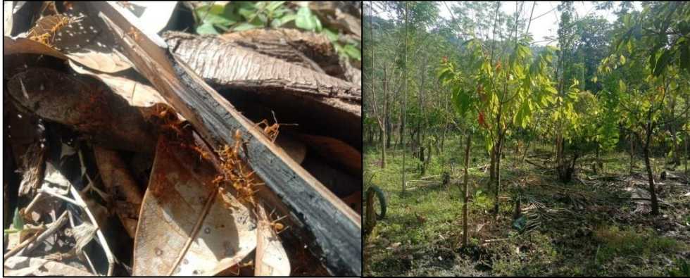
Gambar 3. Foto semut yang terdapat di kebun warga