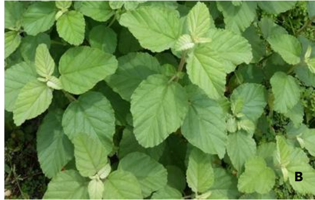
Gambar 2. Perbedaan morfologi daun dari A. P. auricularius dan B. P. cablin . Terlihat adanya perbedaan pada bentuk helaian daun yaitu P. auricularius memiliki helaian daun berbentuk lonjong sedangkan P. cablin memiliki helaian daun berbentuk bulat telur