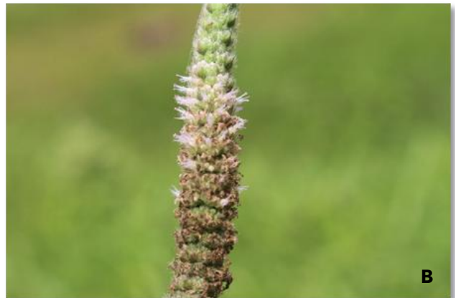
Gambar 3. Morfologi bunga dari P. auricularius .

Kelompok pertama merupakan kelompok dari jenis P. cablin . Kelompok ini terpisah menjadi dua subkelompok yaitu subkelompok yang memiliki tipe indumentum rapat dan subkelompok yang memiliki tipe indumentum jarang pada permukaan batang dan daunnya.