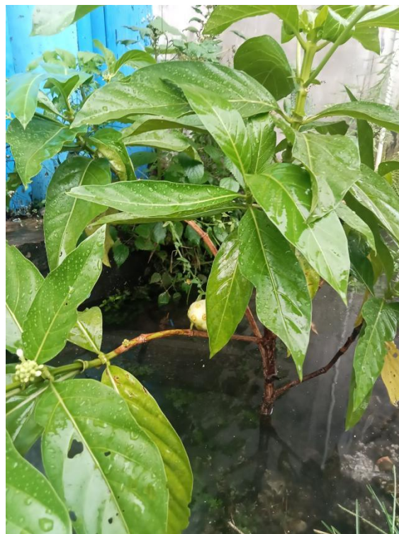
Gambar 1. Daun segar Mengkudu yang bagian pucuknya diambil sebagai sampel uji

Bahan utama yang digunakan adalah daun segar mengkudu ( Morinda citrifolia L.) yang diambil dari bagian tajuk yang sehat. Pemilihan daun difokuskan pada nodus ketiga dan keempat dari pucuk ( mature leaf ) untuk menjamin kematangan jaringan secara fisiologis dan stabilitas karakter anatomi (Raven et al., 2013). Alat-alat yang digunakan meliputi mikroskop binokuler dengan perbesaran hingga 400x, kamera digital mikroskop, kuteks transparan (berbasis nitrocellulose ), selotip bening ( transparent tape ), kaca objek ( object glass ), kaca penutup ( cover glass ), pinset anatomi, silet tajam untuk sayatan manual, serta akuades.