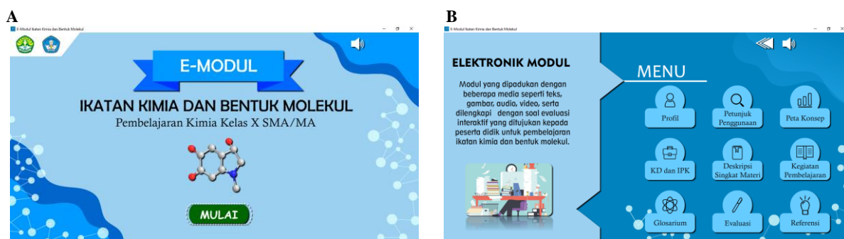
Gambar 1. Tampilan awal e-modul interaktif (A) dan tampilan isi konten e-modul (B)

Tahap selanjutnya adalah tahap desain atau merancang produk yang sesuai untuk mengatasi permasalahan yang ditemukan saat melakukan analisis. Tahap rancangan dimulai dengan membuat skema pengembangan e-modul yang dirancang dengan tampilan flowchart . Pembuatan skema pengembangan dimaksudkan untuk melihat komponen e-modul apa yang dibutuhkan pada setiap bagiannya. Tampilan utama ketika e-modul dibuka adalah halaman awal sebelum masuk ke menu utama. Setelah e-modul mulai digunakan yaitu dengan menekan tombol 'mulai' terlebih dahulu, selanjutnya pengguna akan diperlihatkan tampilan halaman menu utama. Tampilan awal dan isi konten e-modul interaktif dapat dilihat pada gambar 1.