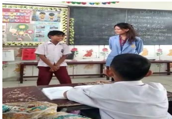
Gambar 6. Siswa yang bersedia memimpin teman-temannya untuk bernyanyi tentang warna