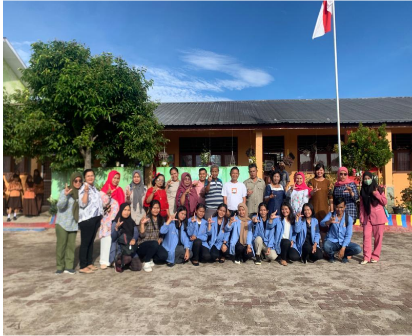
Gambar 11. Foto bersama antara Tim Sosialisasi (mahasiswa) dan guru