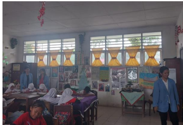
Gambar 4. Pemberian materi oleh miss Dhepany