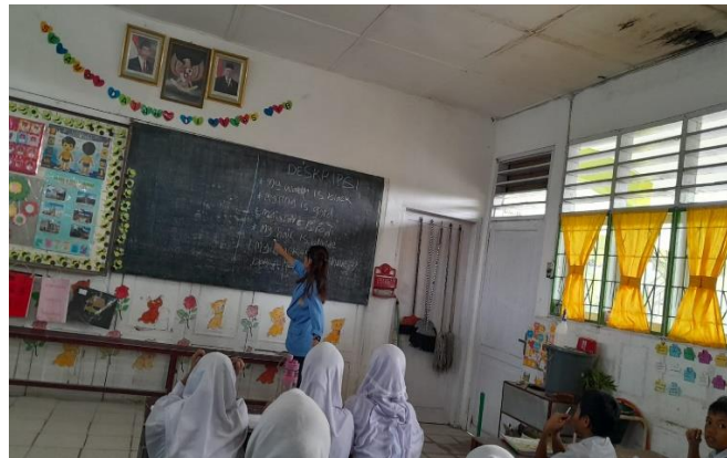
Gambar 5. Mendeskripsikan warna terhadap beberapa benda yang dipakai siswa