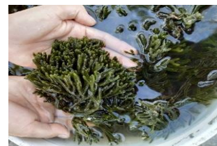
Gambar 1. Codium sp. digunakan dalam penelitian

Rumput laut yang digunakan pada penelitian ini adalah Codium sp. atau biasa disebut pencuri tiram (Gambar 1). Bibit dibersihkan terlebih dahulu dari kotoran-kotoran yang menempel dan diaklimatisasi dalam baskom yang berisi air laut yang telah melalui saringan agar bibit rumput laut tidak mengalami stres. Seetalah itu, bibit ditimbang dengan bobot awal yang berbeda sesuai dengan perlakuan 50 g, 100 g, 150 g dan 200 g dan disimpan pada wadah berupa kotak plastik.