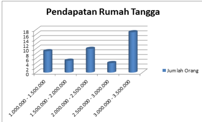
Gambar 1. Grafik Pendapatan Rumah Tangga Petani Rumput Laut

Dari tabel 1 dan gambar 1 terlihat bahwa pendapatan petani rumput laut secara umum dapat dikategorikan layak dengan kisaran Rp. 3.000.000 sampai dengan Rp. 3.500.000 dengan jumlah responden paling banyak yaitu sebanyak 17 orang. Hal ini menjadi salah satu faktor banyaknya masyarakat yang berminat menekuni usaha rumput laut.