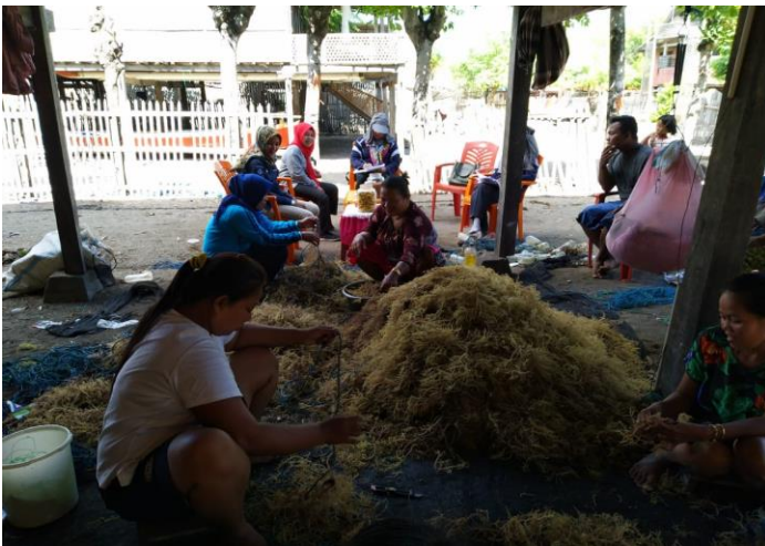
Gambar 4. Aktivitas Gotong Royong Petani Rumput Laut