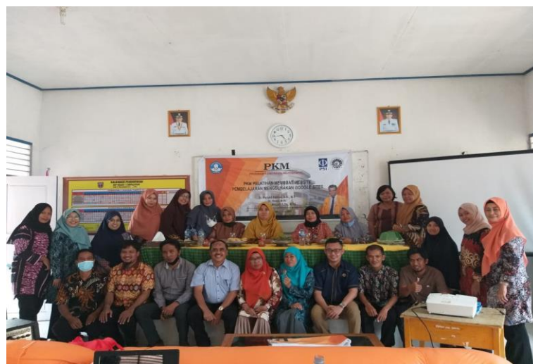
Gambar 3. Foto Bersama dengan peserta dan tim PkM