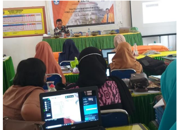
Gambar 1. Pemaparan materi PkM