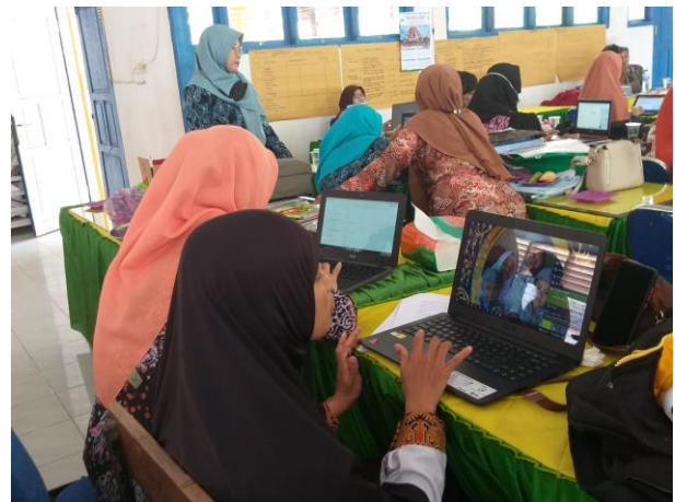
Gambar 2. Pelaksanaan kegiatan PkM