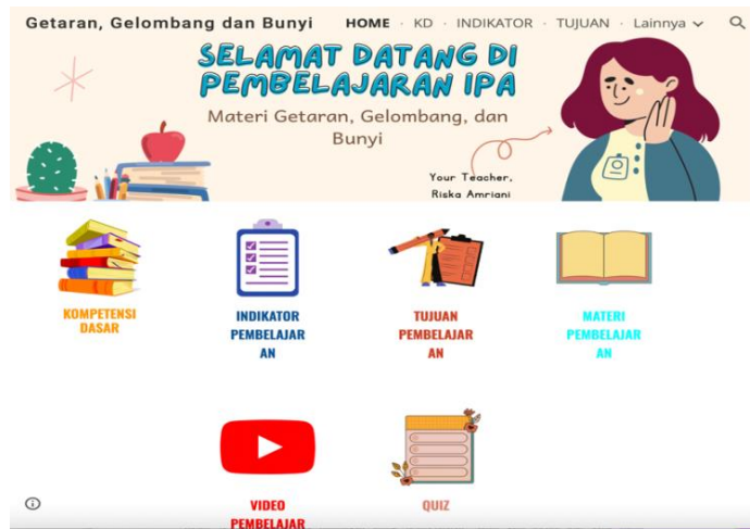
Gambar 4. Contoh google sites yang telah dibuat

Adapun Contoh media google sites yang dibuat yaitu https://sites.google.com/view/mediapembelajaran-getaran/home