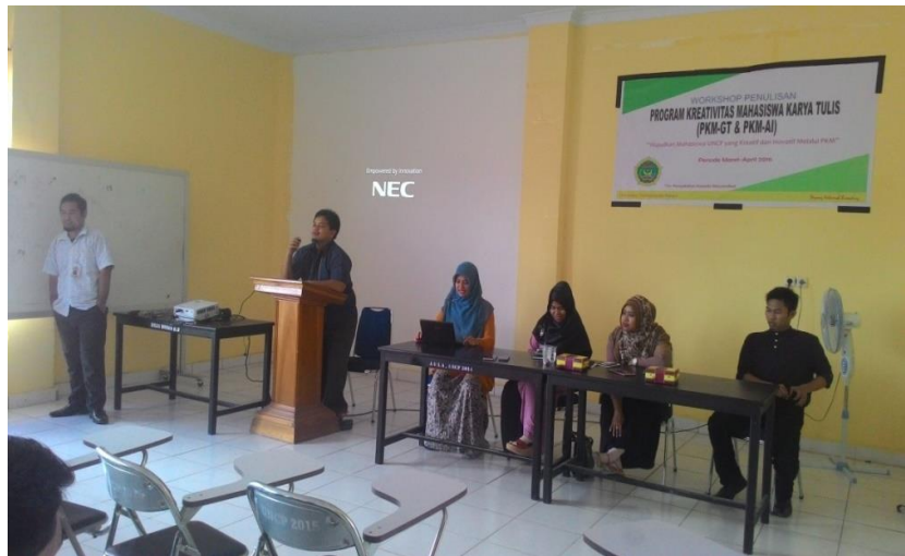
Gambar 2. Pemberian materi pertama

Materi pertama, mahasiswa memahami pentingnya menulis dan manfaat yang dapat diperoleh dari menulis karya ilmiah. Hal ini dilakukan untuk memicu motivasi menulis mahasiswa. Proses pemberian materi untuk merangsang motivasi menulis mahasiswa dilakukan melalui berbagai metode. Selain itu, pada dokumen pertama, mahasiswa juga dilatih untuk mengembangkan ide kreatif untuk dijadikan karya ilmiah. Untuk menemukan ide-ide kreatif yang muncul di benak mahasiswa, di akhir materi, diinstruksikan untuk melihat berbagai masalah yang ada di sekitarnya. Selanjutnya, mahasiswa diminta untuk memberikan setidaknya satu solusi terhadap masalah atau masalah tersebut. Dari pantauan panitia, mahasiswa mempresentasikan berbagai isu, antara lain sampah, pendidikan, kearifan lokal, korupsi, bencana alam, energi terbarukan, dan lainnya.