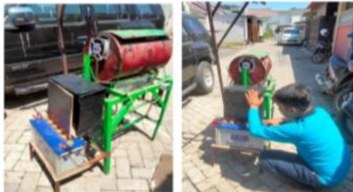
Gambar 1. Hasil Perancangan Mesin Pengering Gabah

Mesin pengering gabah dengan menggunakan pengontrolan PD merupakan mesin yang dibuat untuk mempermudah proses pengeringan gabah yang selama ini masih menggunakan panas matahari. Mesin ini juga dirancang dan dibuat dengan keamanan dan kenyamanan operator sehingga mengurangi resiko kerja. Mesin pengering gabah tipe rotary dengan menggunakan pengontrolan PD ini terdiri dari berbagai komponen. Komponen-komponen utama terdiri dari rangka mesin, silinder pengering, poros, kompor, pengaduk, dan output pengeluaran. Komponen-komponen dirakit sesuai desain yang kemudian menghasilkan mesin pengering gabah.