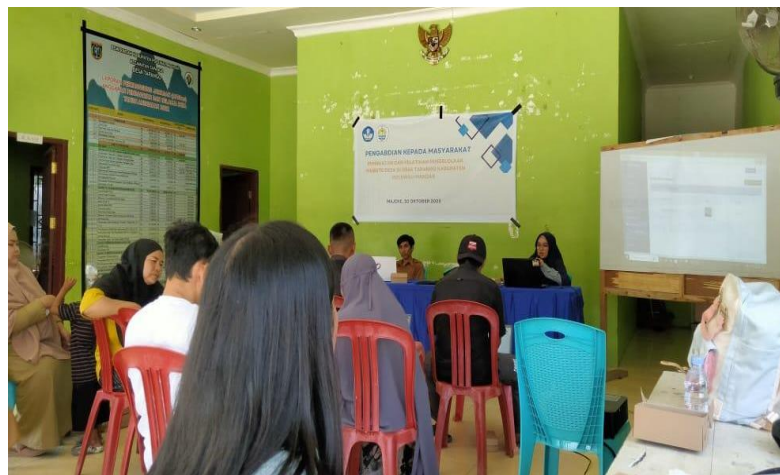
Gambar 2. Pembuatan dan Pelatihan Pengelolaan Website

Kegiatan ini diikuti oleh 14 orang aparat desa di Desa Tapango, Kabupaten Polewali Mandar. Kegiatan ini dimulai dengan tahapan komunikasi dengan mitra untuk mengetahui permasalahan-permasalahan yang dihadapi dalam pelayanan administrasi masyarakat, menjelaskan dan meyakinkan bahwa pemanfaatan website adalah solusi yang ditawarkan atas permasalahan yang dihadapi dan menyepakati jadwal pelaksanaan kegiatan. dilanjutkan ke tahapan persiapan yaitu dengan menyiapkan alat yang dibutuhkan untuk pelaksanaan pelatihan. Selanjutnya pelaksanaan pembuatan dan pelatihan pengelolaan website sebagai media informasi dan komunikasi yang dilaksanakan pada hari Senin tanggal 30 Oktober 2023, yang kemudian dilanjutkan dengan monitoring dan evaluasi dalam penggunaan dan pengisian konten pada website yang nantinya dapat digunakan sebagai wadah informasi bagi masyarakat untuk mengetahui tentang Desa Tapango.