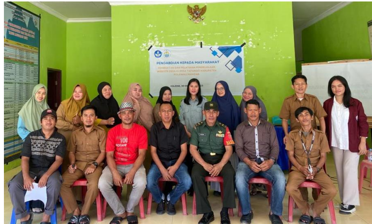
Gambar 1. Pembuatan dan Pelatihan Pengelolaan Website

Kegiatan pembuatan dan pelatihan pengelolaan website sebagai media komunikasi untuk mempermudah aparat desa dalam mempresentasikan hasil kinerja ataupun produk – produk yang ada dalam desa tersebut. Selain itu penggunaan Sistem Informasi Desa akan mempermudah dalam pekerjaan dan merupakan salah satu bentuk pengabdian kepada masyarakat yang telah terlaksana dengan baik.