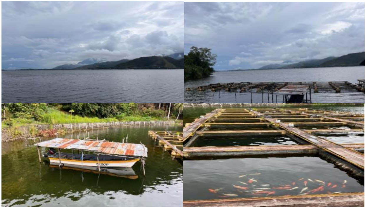
Gambar 3. Observasi permasalahan dan potensi budidaya

Gambar berikut menunjukkan pelaksanaan kegiatan pengabdian: