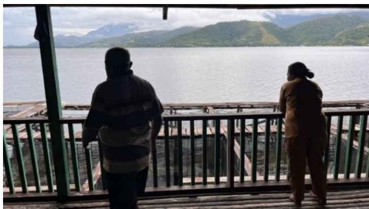
Gambar 4. Diskusi Teknis dan Evaluasi Desain Prototipe