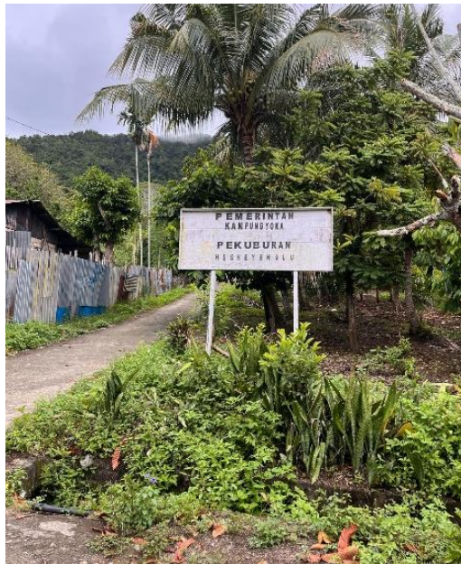
Gambar 1. Lokasi pengabdian Masyarakat di Kampung Yoka