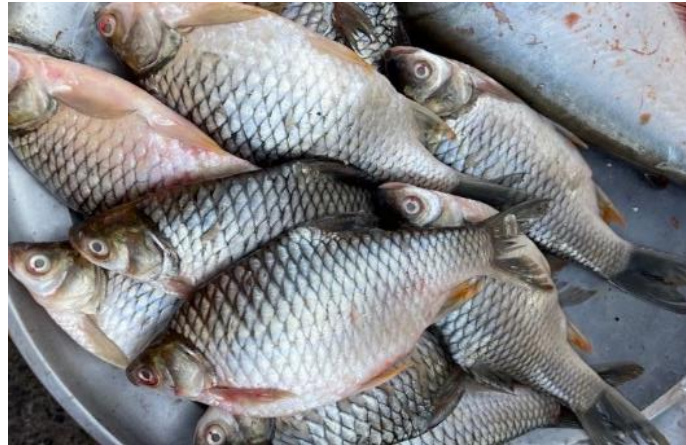
Gambar 5. Ikan Mujair yang dibudidaya

Hasil dari kegiatan ini menunjukkan bahwa desain awal alat pembuat pakan ikan mendapat respons positif dari para pembudidaya. Diskusi bersama kelompok Oblokhouw Sejahtera Mandiri menghasilkan berbagai masukan yang berguna untuk penyempurnaan desain, seperti kebutuhan akan alat yang mudah dioperasikan, hemat energi, serta mampu mengolah bahan baku lokal menjadi pakan dengan kualitas yang sesuai standar budidaya.