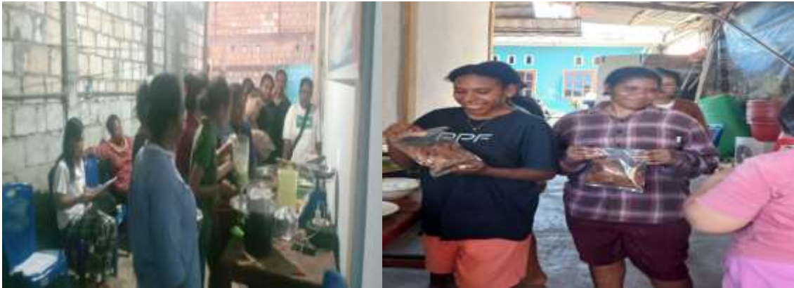
Gambar 3. Tim Pengabdian sedang memberikan materi pelatihan dan Produk Kipik Ikan Tuna Daun Kelor yang telah dikemas