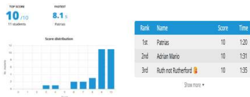
Gambar 3. Grafik distribusi nilai peserta didik

Hasil dari quiz terdapat 11 siswa berhasil meraih skor sempurna, yaitu 10 dari 10 soal, yang berarti peserta didik dapat menjawab seluruh pertanyaan dengan benar. Hal ini mencerminkan bahwa mayoritas siswa telah memahami materi yang diajarkan dengan sangat baik. Nilai sempurna yang diperoleh oleh sebagian besar peserta menunjukkan efektivitas media pembelajaran yang digunakan serta keberhasilan metode pengajaran yang diterapkan selama kegiatan. Siswa bernama Patrias berhasil menyelesaikan seluruh soal dengan benar dalam waktu 8,1 detik, yang merupakan waktu tercepat di antara seluruh peserta. Hal ini dapat dianalisis sebagai indikator penguasaan materi yang sangat tinggi, serta kemampuan kognitif dan refleksi siswa dalam merespons soal dengan cepat dan tepat. Waktu penyelesaian yang sangat singkat ini juga menunjukkan adanya keterampilan berpikir kritis dan efisiensi dalam mengambil keputusan. Grafik dapat dilihat pada gambar 3.