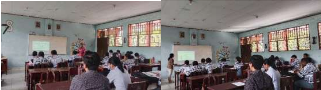
Gambar 1. Penyampaian materi Energi Terbarukan dan Wordwall

Program pengabdian ini dilaksanakan selama 5 bulan di SMA Teruna Bakti Waena Jayapura di kelas X, kegiatan pertama yang dilakukan tim pengabdian adalah tanya jawab secara langsung kepada siswa-siswi mengenai Energi Terbarukan agar Tim pengabdian mengetahui pengetahuan dasar peserta didik. Kegiatan Kedua tim pengabdian menyampaikan materi tentang Energi terbarukan dan Wordwall . Kegiatan ketiga kuis menggunakan Wordwall untuk meningkatkan keterampilan siswa dalam memanfaatkan teknologi, khususnya dalam proses pembelajaran Fisika. Berikut adalah dokumentasi kegiatan pada saat penyampaian materi kepada peserta didik.