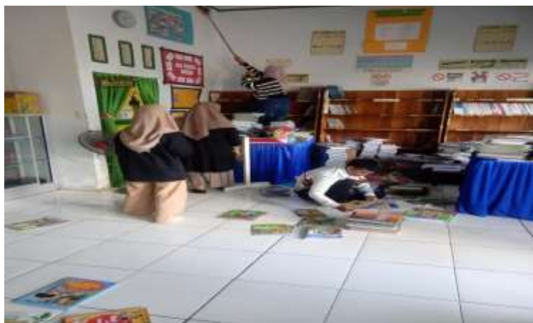
Gambar 2. Pembersihan Ruang Perpustakaan

Hasil berikutnya terlihat pada aspek kenyamanan membaca. Ruang baca menjadi lebih bersih dan tertata, didukung pengaturan tempat duduk (meja/kursi/karpet baca sesuai ketersediaan), penyesuaian pencahayaan, serta penempatan ventilasi atau bukaan ruang agar sirkulasi udara lebih baik. Tata tertib sederhana dipasang untuk menjaga ketertiban, kebersihan, dan keamanan koleksi. Berdasarkan umpan balik siswa melalui diskusi singkat/kuesioner, siswa menyatakan lebih nyaman berada di ruang baca karena ruangan tidak berdebu, buku mudah dijangkau, serta tersedia area baca yang lebih enak digunakan. Guru juga menyampaikan bahwa ruang baca lebih mudah dimanfaatkan untuk kegiatan literasi terjadwal karena kondisi ruangan lebih siap dan tidak memerlukan penataan ulang setiap kali digunakan.