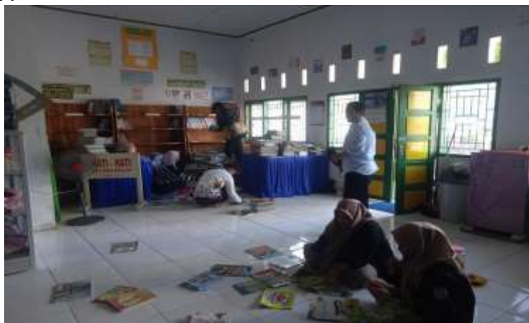
Gambar 1. Proses Pengelompokkan Buku di Perpustakaan

Setelah program berjalan, hasil utama pada aspek penataan ruang ditunjukkan melalui penerapan zoning yang lebih jelas. Area koleksi dipisahkan dari area baca sehingga ruang menjadi lebih lapang dan sirkulasi siswa lebih nyaman. Rak disusun mengikuti alur pergerakan pengguna (masuk–pilih buku–baca–peminjaman) dan tidak lagi menutup jalur. Selain itu, disiapkan pojok rekomendasi (misalnya “buku populer”, “buku baru”, atau “bacaan kelas rendah/tinggi”) untuk memudahkan siswa memilih bacaan tanpa harus mencari lama. Perubahan tata letak ini membuat ruang baca tampak lebih rapi, terang, dan ramah siswa, sekaligus mengurangi kesan “ruang penyimpanan buku” menjadi “ruang belajar dan membaca”.