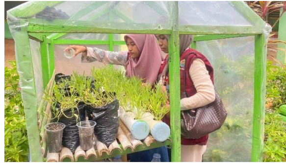
Gambar 2. Penanaman tanaman berbagai jenis hortikultura

Proses penanaman tanaman kangkung dilakukan secara berkelompok dan memperhatikan jarak tanam dan teknik penanaman yang benar. Pada tahap ini digunakan pendekatan story telling , di mana mahasiswa pendamping menyampaikan hubungan antara nutrisi tanah, air, dan pertumbuhan tanaman melalui cerita kontekstual. Pendekatan ini terbukti efektif dalam membantu siswa memahami konsep sains secara sederhana dan menarik. Hasil pengamatan awal menunjukkan bahwa sebagian besar tanaman mampu beradaptasi dengan baik, ditandai dengan tidak adanya gejala layu berlebihan dan respons positif terhadap penyiraman rutin.