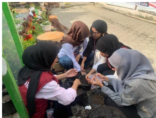
Gambar 1. Pencampuran media tanam

Hasil Pelaksanaan Program mini greenhouse sebagai media edukasi hortikultura di SMP SATAP Baurung Majene menunjukkan hasil yang positif dalam meningkatkan pengetahuan, keterampilan, serta nilai cinta alam siswa. Kegiatan diawali dengan diskusi interaktif mengenai fungsi tanah dan bahan organik sebagai media tumbuh tanaman. Diskusi ini menjadi dasar pemahaman awal siswa sebelum memasuki tahap praktik, sehingga siswa tidak hanya melakukan aktivitas secara mekanis, tetapi juga memahami konsep ilmiah yang mendasarinya.