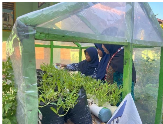
Gambar 3. Pemeliharaan tanaman

Proses penanaman tanaman kangkung dilakukan secara berkelompok dan memperhatikan jarak tanam dan teknik penanaman yang benar. Pada tahap ini digunakan pendekatan story telling , di mana mahasiswa pendamping menyampaikan hubungan antara nutrisi tanah, air, dan pertumbuhan tanaman melalui cerita kontekstual. Pendekatan ini terbukti efektif dalam membantu siswa memahami konsep sains secara sederhana dan menarik. Hasil pengamatan awal menunjukkan bahwa sebagian besar tanaman mampu beradaptasi dengan baik, ditandai dengan tidak adanya gejala layu berlebihan dan respons positif terhadap penyiraman rutin.